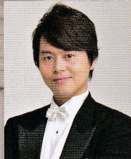
山本 康寛 (テノール) Yasuhiro YAMAMOTO, Tenor