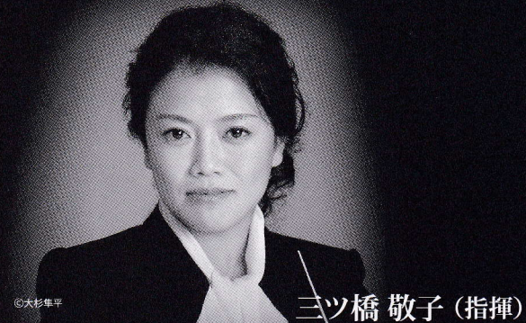
三ツ橋 敬子 (指揮)

来る2020年ベートーヴェンイヤーを前に、オール・ベートーヴェン・プログラムでひと足先にベートーヴェンの世界をお楽しみください。オペラ界を代表するスター歌手やびわ湖ホール声楽アンサンブル・ソロ登録メンバーによる4名の独唱と300名の大合唱団に関西の雄、大阪フィルとの豪華ステージ。年末を締めくくる珠玉の演奏にどうぞ期待ください!